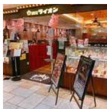
「銀座ライオン」恵比寿店