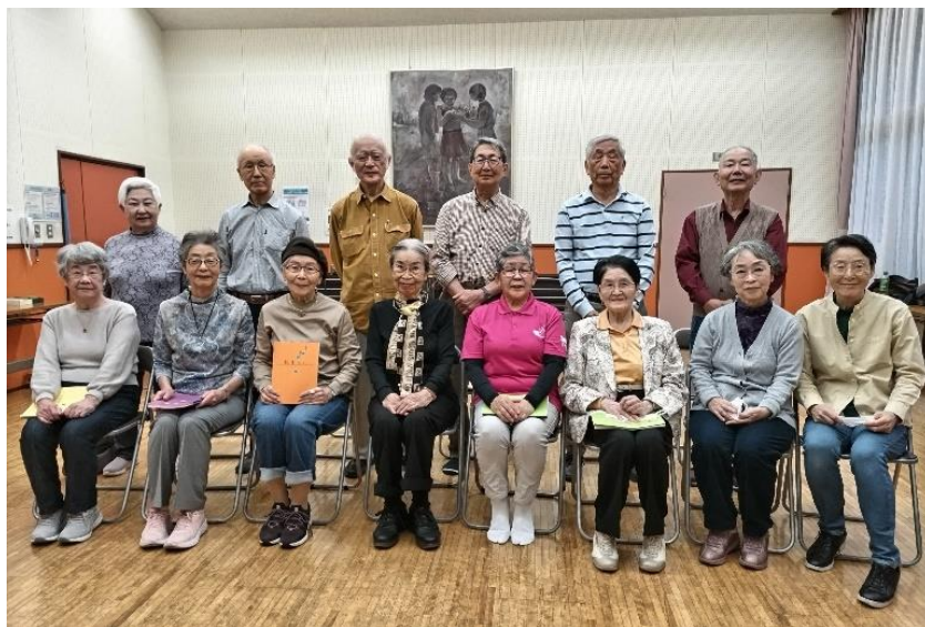
10月30日サロン集合写真