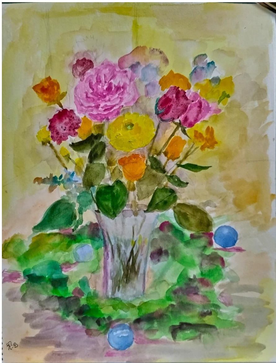
恩田 博さんの作品