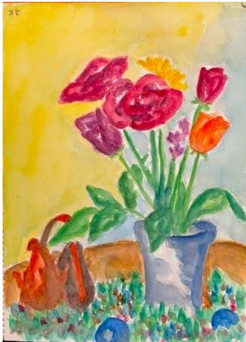
武智康子さんの作品