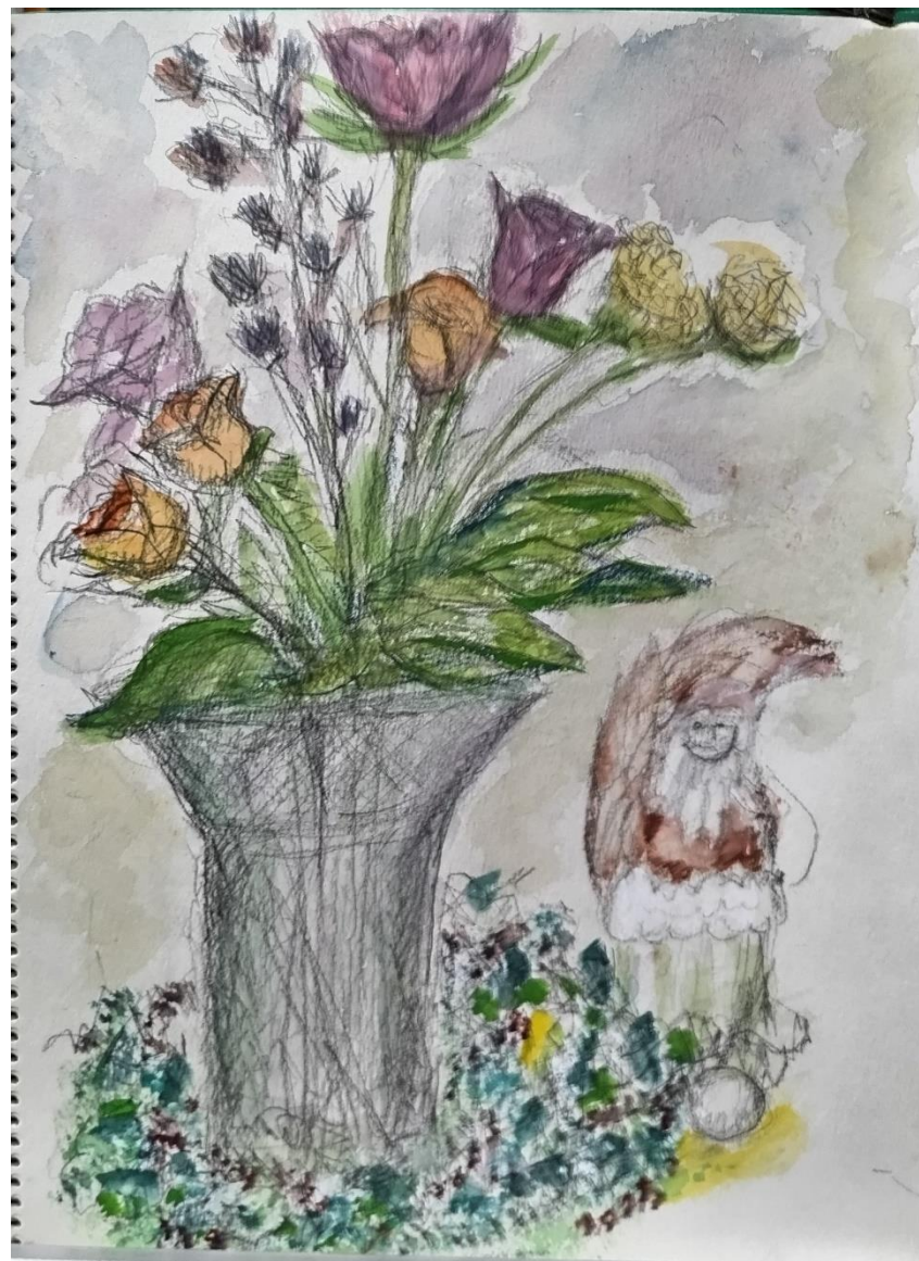
上口房子さんの作品