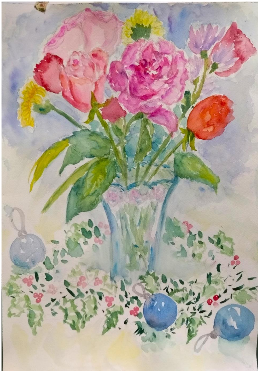
岡田理子さんの作品