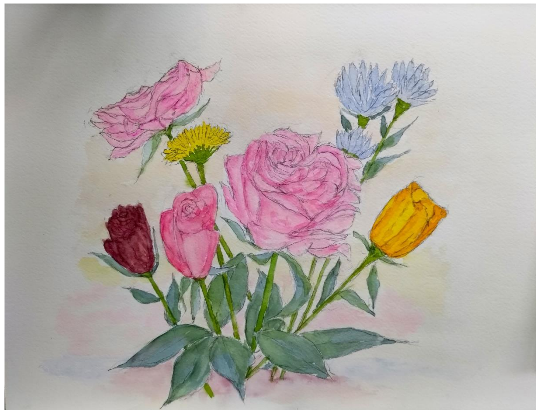
黒田重雄さんの作品