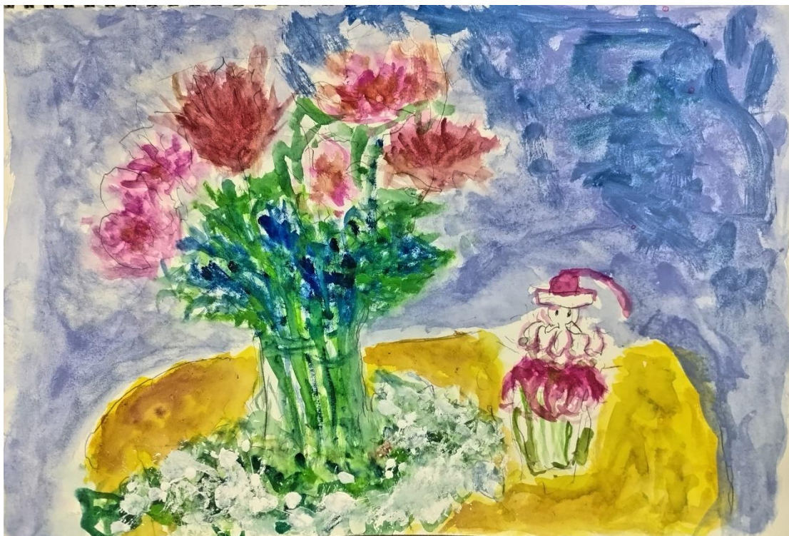
井上清彦さんの作品