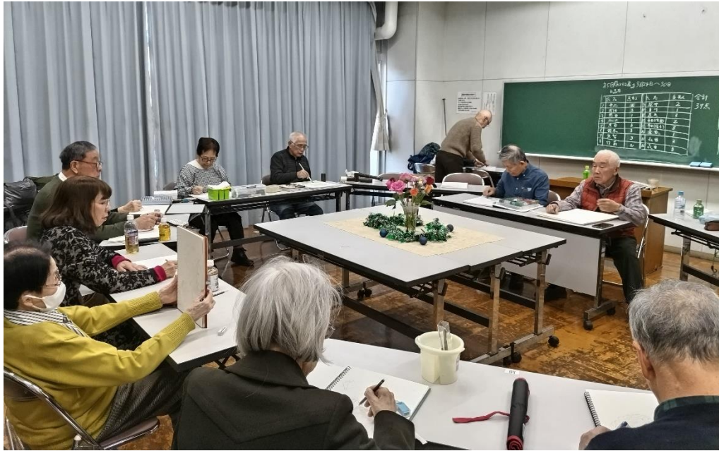
作品制作中の会場風景です。 物音一つしない緊張した会場の空気が好きです。

「グリル・シャトー」は 63 年続いたお洒落なイタリアンのお店です。 八重洲口に在った時には、随分仕事で使わせていただきました。 大きなお店だった「八重洲口店」が「いえす口再開発で閉店になり 「新橋」に移転しましたが、新橋店は本当に狭い窮屈なお店になっ てしまいました。 それでも、お洒落なレトロな感じは残っていて、「あとリエ」ではここ 2 年程、利用しました。残念ながら今年末で 63 年の歴史に幕を下 ろします。感謝を込めて、「有難う、グリル・シャトー！！」