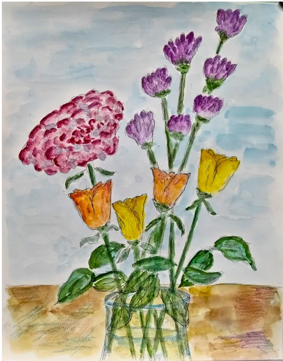
竹前義博さんの作品