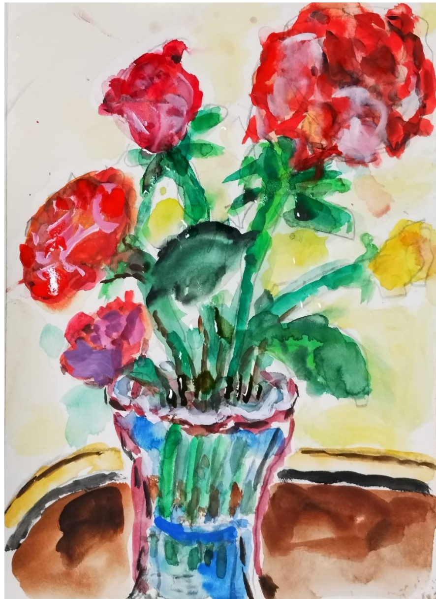
喜田祐三さんの作品