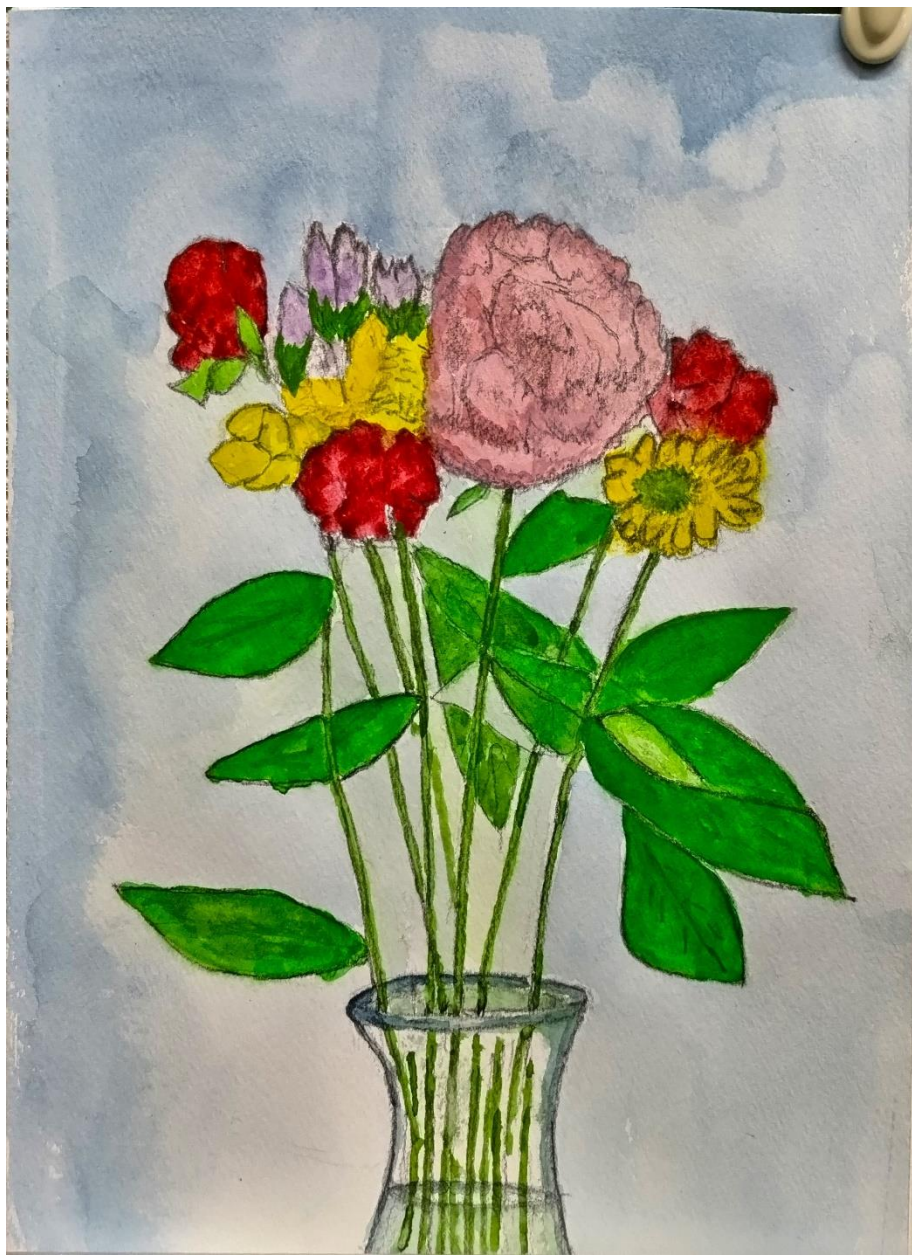
筒井隆一さんの作品